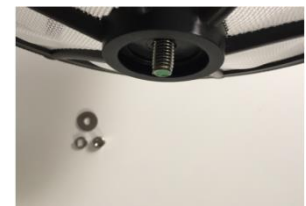
Abb. 3: Montage Filter 1.