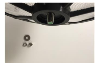
Abb. 3: Montage Filter 1.