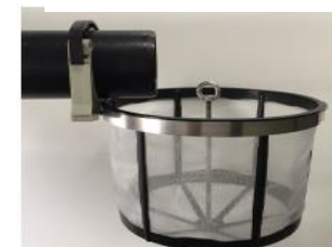
Abb. 4: Montage Filter 2. Zulaufrohr

Reinigen Sie den Filterkorb bei starker Verschmutzung mit einem Wasserstrahl. Drehen Sie dazu den Filterkorb um und spritzen ihn von der Außenseite ab. Eine zusätzliche Verwendung von Reinigungsmitteln wird nicht empfohlen.