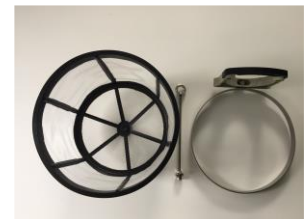
Abb. 2: Lieferumfang Filter