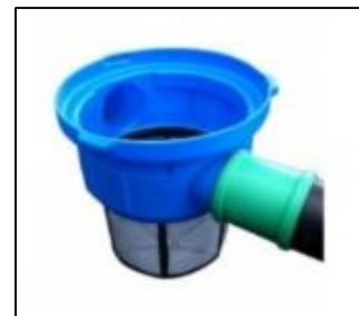
Abb. 3: Gartenfilter Comfort